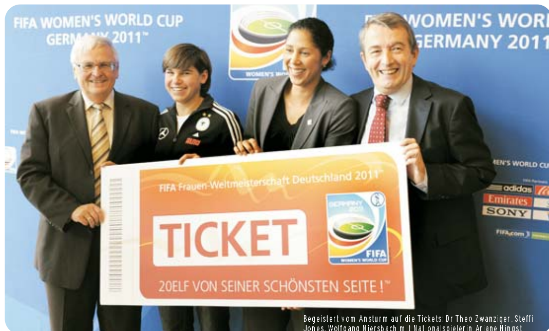
Begeistert vom Ansturm auf die Tickets: Dr Theo Zwanziger, Steffi Jones, Wolfgang Niersbach mit Nationalspielerin Ariane Hingst

*) 0,4 €Cent/Min. aus dem deutschen Festnetz, Mobilfunkpreise können abweichen