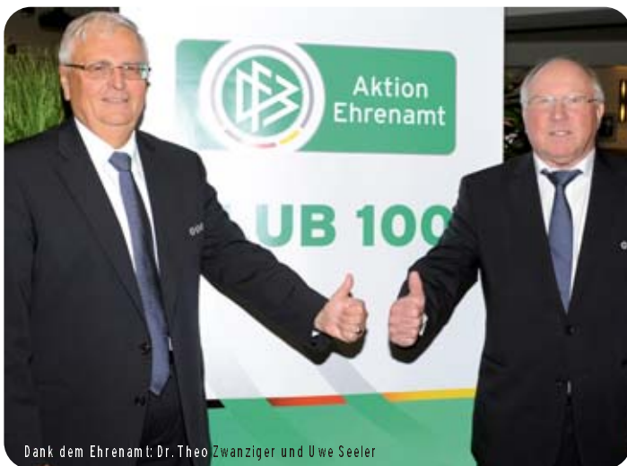
Dank dem Ehrenamt: Dr. Theo Zwanziger und Uwe Seeler